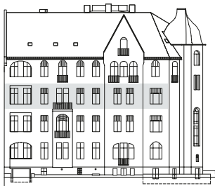
Ansicht Karlsbader Strasse