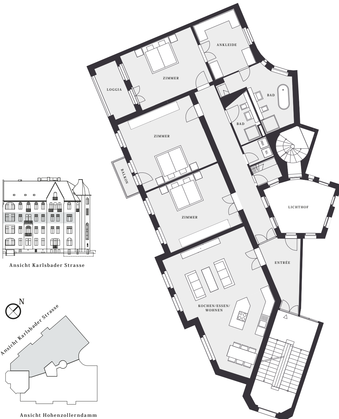
Ansicht Karlsbader Strasse