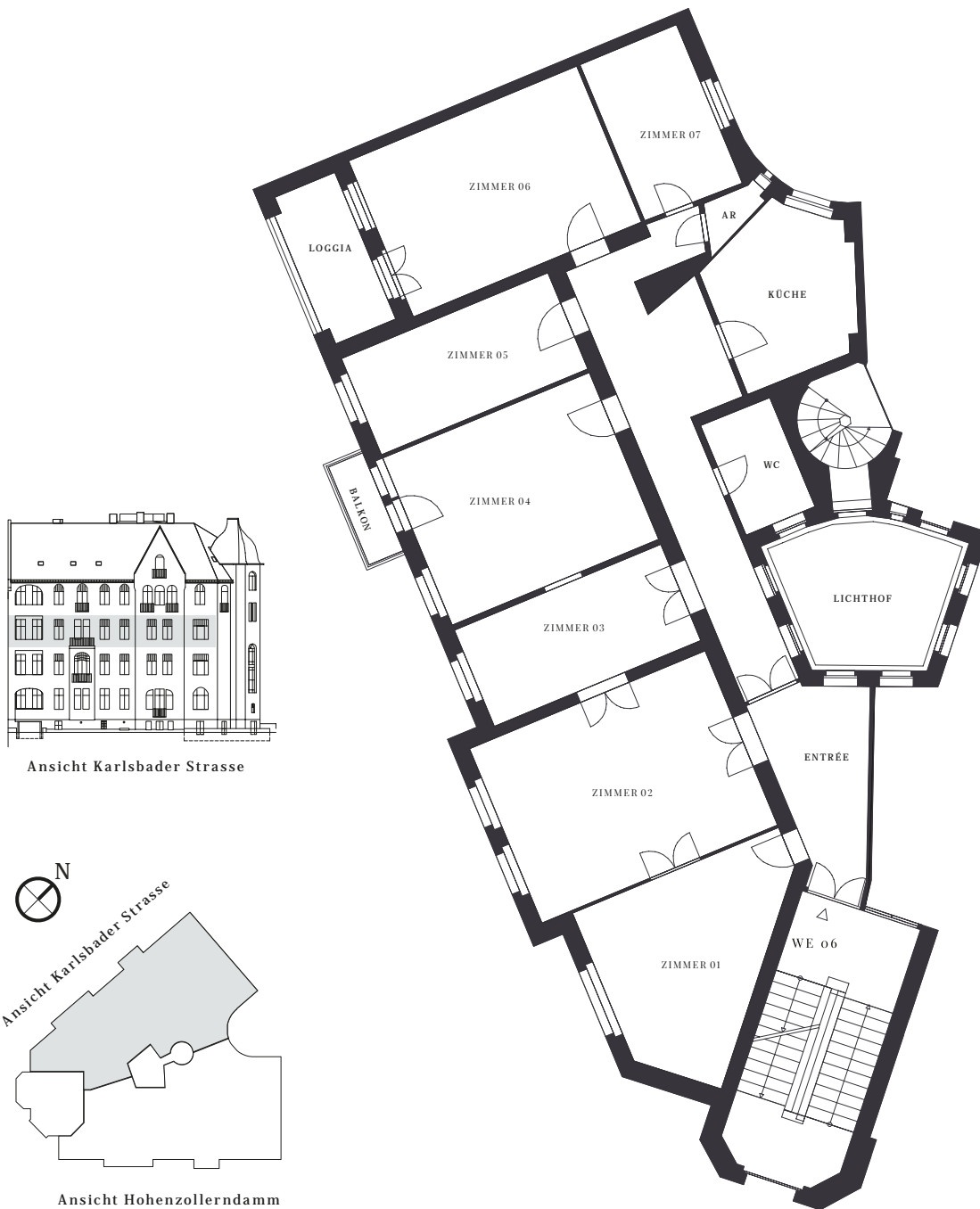
Ansicht Karlsbader Strasse